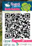
I testi sono dell'Ing. Prof. Michelino Nigro e Carlo Trillo. Grafica e Stampa: DEMA Bagnoli Irpino (AV) - www.demaxp.com

PRO LOCO BAGNOLI-LACENO - Via Garibaldi, 39, Bagnoli Irpino Avellino Telefono: 0827 602601